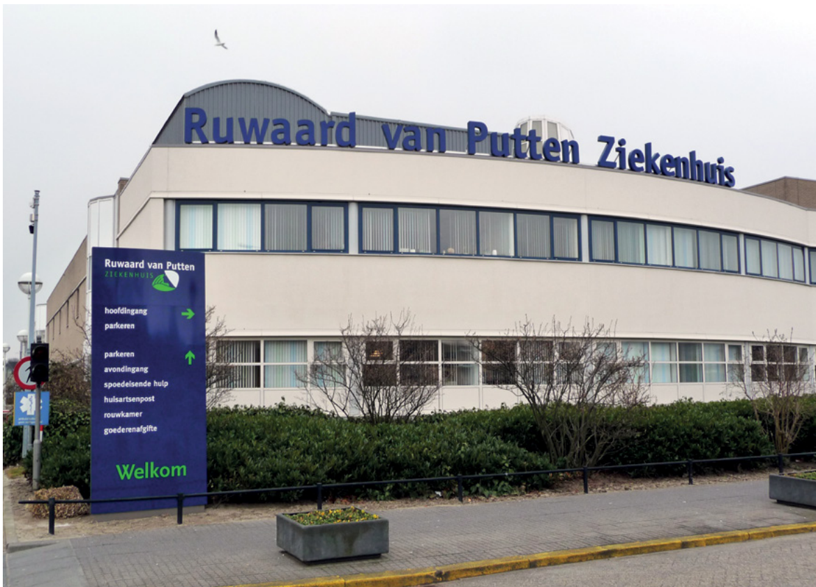
Figuur 1: Ruwaard van Putten Ziekenhuis.

De aanleiding voor dit onderzoek was de sluiting van de afdeling cardiologie van het voormalige Ruwaard van Putten Ziekenhuis in november 2012 op last van de IGZ. In de aanloop naar deze gebeurtenis had het ziekenhuis al geconstateerd dat bij bepaalde cardiologische aandoeningen sprake was van verhoogde en vermijdbare sterfte. De sluiting leidde tot vragen in de samenleving over de veiligheid van de zorg en meer specifiek over het gebruik van morfine bij terminale hartpatiënten.