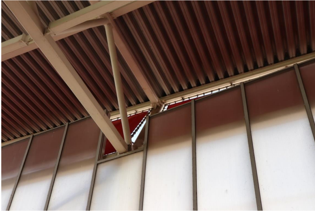
Overzichtsfoto: locatie breuk bovenspan