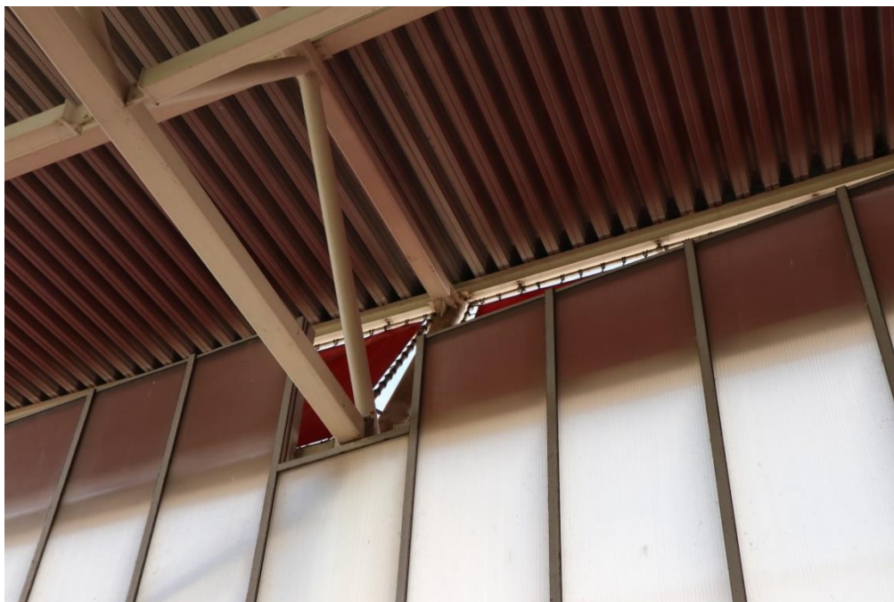
Overzichtsfoto: locatie breuk bovenspant