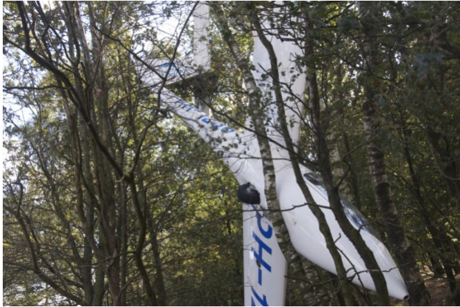
Afbeelding 2: PH-1236 na landing in de bomen

Ter plaatse van het ongeval heersten zichtvliegomstandigheden. Het zicht was meer dan tien kilometer en er was geen neerslag. De wind aan de grond was 16 knopen uit noordelijke richting en op 500 voet 25 knopen uit de richting 010 graden.