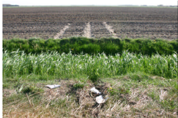
Foto's 1-4: D-ERPW na het ongeval