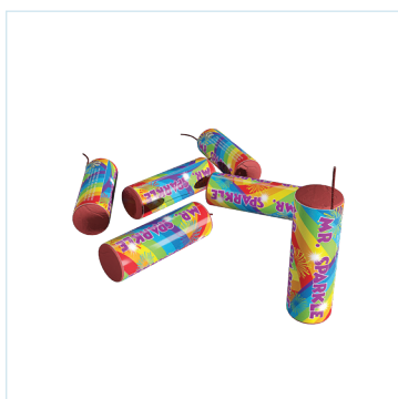
Grondbloemen / Grondtollen