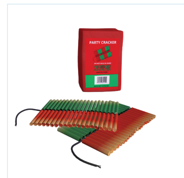
Voorbeelden van knalvuurwerk