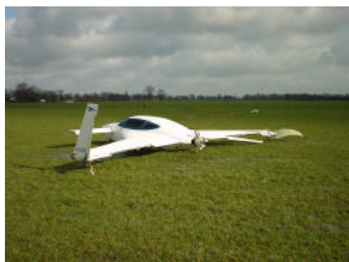
N111KE na het ongeval

Bij technisch onderzoek is gebleken dat de luchtslang naar de motorinlaat uit twee delen bestond. De verbinding van de twee stukken slang was gerealiseerd door het ene stuk over een lengte van circa 10 cm in het andere te schuiven. Deze verbinding werd na het ongeval los aangetroffen en is waarschijnlijk tijdens de vlucht losgeraakt. Vanaf het moment dat de verbinding was losgeraakt werd de lucht uit het motorcompartiment gezogen. Door de zuigkracht van de motor werd de aanzuigslang vastgezogen op de binnenzijde van de motorruimte. Hierdoor stopte de motor bijna. Op het moment van bijna stoppen nam de zuigkracht af en liet de slang weer los, waardoor de motor weer meer toeren ging draaien. Dit proces heeft zich enkele malen herhaald. Aangezien het vliegtuig niet was voorzien van een 'alternate air' inlaat kon deze ook niet geselecteerd worden.