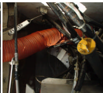
Aanzuigslang zoals het behoort

Naschrift: inmiddels is een 'alternate air' inlaat aangebracht.